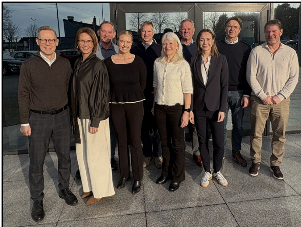
Styret pr 31.12.25

Anette Matre var ikke tilstede da bildet ble tatt.