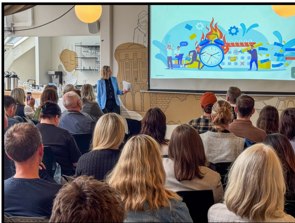
Afternoon Tech er et populært arrangement som arrangeres i samarbeid med DNB og Validè Haugesund.

Næringsforeningen er medarrangør og samarbeidspartner på en rekke arrangementer. Bærekraftsdagen, Afternoon Tech, arrangementer om økonomiske utsikter og Veikonferansen er noen eksempler.